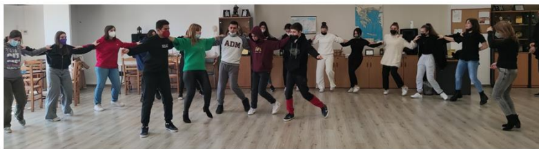
QR THRIASION UNIVERSITY ΕΦΗΒΩΝ

Οι μαθητές και οι εκπαιδευτικοί του προγράμματος συμμετείχαν στον διαγωνισμό Education Leaders Awards 2022 με τη δημιουργία ενός δικτύου συνεργαζόμενων σχολείων της Δευτεροβάθμιας Εκπαίδευσης (δημοσίων και ιδιωτικών). Ταυτόχρονα σχεδιάστηκε μια πλατφόρμα που εμπεριέχει δράσεις και ψηφιακά παιχνίδια με QR CODE. Μέσα από τα προαναφερθέντα οι μαθητές προσέγγισαν την ιστορική γνώση του Μικρασιατικού Ελληνισμού με παιγνιώδη τρόπο. Παράλληλα, έγινε προσπάθεια για καλλιέργεια και ανάδειξη soft skills (συναισθηματική νοημοσύνη, ενεργητική ακρόαση, δια ζώσης κοινωνικοποίηση, ενίσχυση αυτοπεποίθησης). Η προσπάθειά μας βραβεύτηκε με το Χρυσό Βραβείο (Gold) στον τομέα ανάπτυξης οριζόντιων δεξιοτήτων.